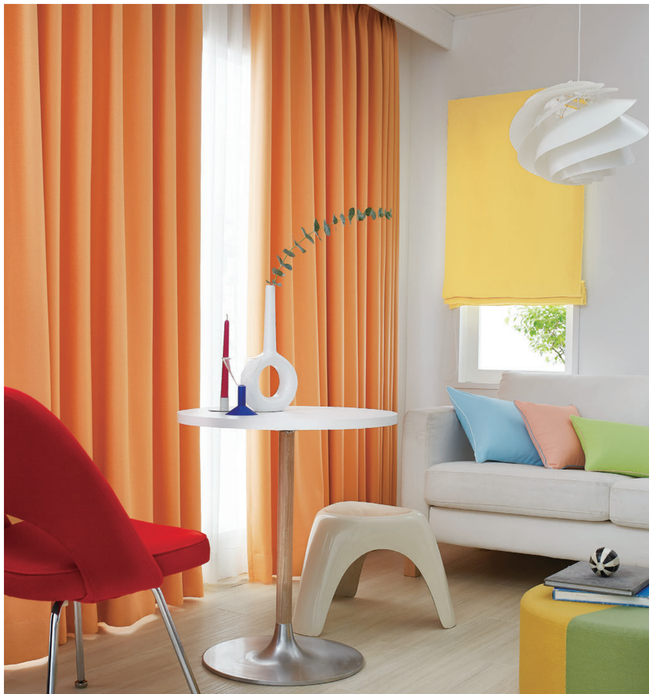
(左窓) [ドレープ] TKF10530 ソフトブリーツ [レース] TKF10691 ソフトブリーツ (右窓) [プレーンシェード] TKF10529 [クッション] (左) TKF10527 (中) TKF10531 (右) TKF10528 CS-T 別注縫製