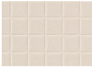
BNA2101 溶接棒 BNYO2101 アイボリー

キャスター走行性や接触温熱感に優れた浴室・浴場用シートです。機械浴室での使用にオススメです。