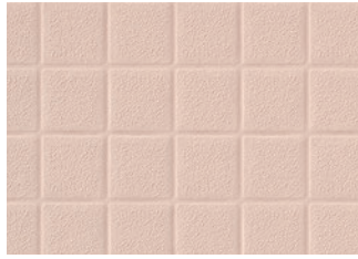
BNA2102 溶接棒 BNYO2102 ピンク

■抗菌性 (抗菌活性値) JIS Z 2801 準拠 JISでは、抗菌活性値が2.0以上のとき、抗菌効果があるものと判断しています。