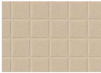
BNA2103 溶接棒 BNYO2103 ベージュ