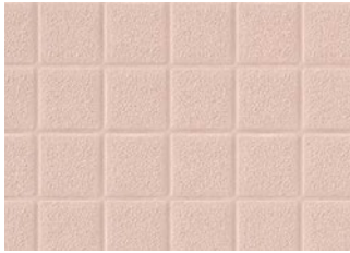
BNA2102 NEW 溶接棒 BNYO2102 ピンク