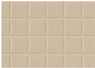
BNA2103 NEW 溶接棒 BNYO2103 ページュ