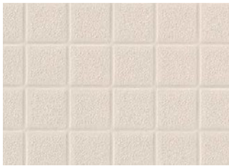
BNA2101 NEW 溶接棒 BNYO2101 アイボリー

キャスター走行性や接触温熱感に優れた浴室床シートです。機械浴室での使用におすすめです。