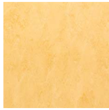
FPT2022 ネーブルス イエロー