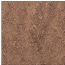
FPT2003 ガーネット ブラウン