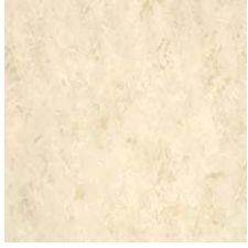
FPT2010 セラミック イエロー