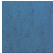
FPT2035 オーシャンブルー