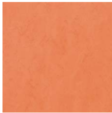
FPT2066 ブラッドオレンジ