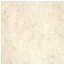
FPT2009 セラミック ホワイト