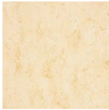
FPT2050 フローラル イエロー