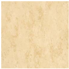
FPT2013 フレンチベージュ