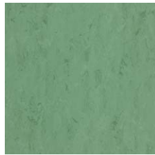
FPT2077 フォレスト グリーン