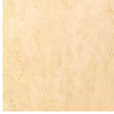
FPT2012 イエローベージュ