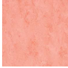
FPT2048 フラミンゴピンク