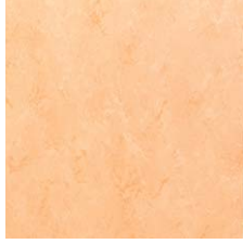
FPT2021 クリームオレンジ