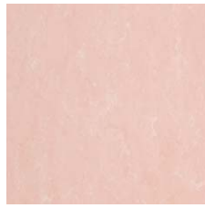
FPT2075 スモーキー ピンク