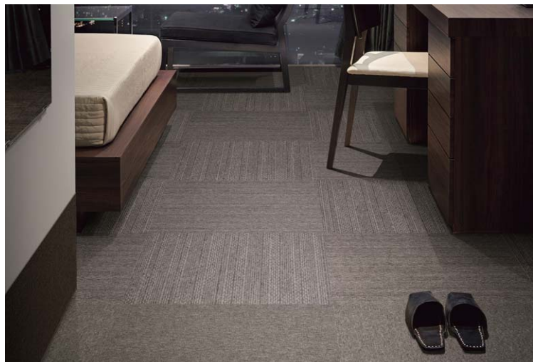
WTH300706/GA4035 (GA-400・74頁)/GA5702 (GA-570・84頁)