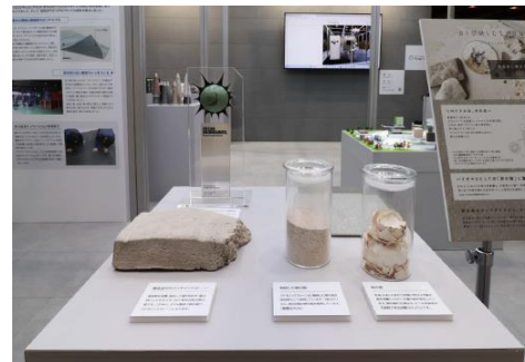
「バイオミックストーン」の製造過程を紹介