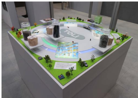
「TOLI 完全循環型リサイクルシステム」の模型

当社ブースは、グリッド形状を活かしたシンプルなデザインとし、タイルカーペットの「TOLI 完全循環型リサイクルシステム」や、卵の殻を原材料として使用したビニル床タイル「バイオミックストーン」など、持続可能な社会の実現に向けた取り組みを中心に展示しました。