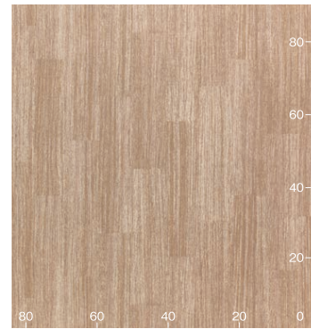
NS850 番台 (木目調) (cm)