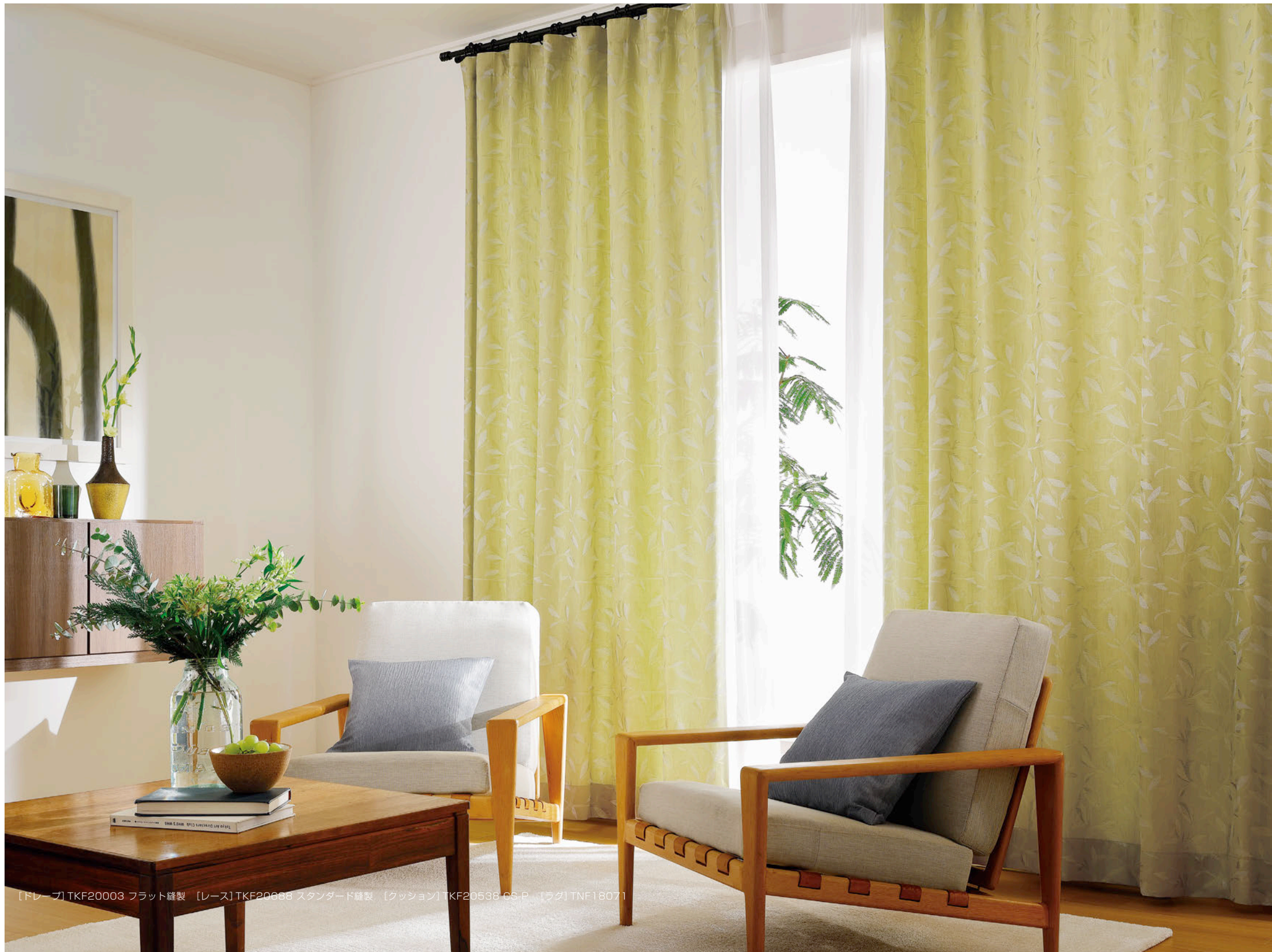
【ドレープ】TKF20003 フラット縫製 【レース】TKF20088 スタンダード縫製 【クッション】TKF20538 GS-P 【ラグ】TNF18071