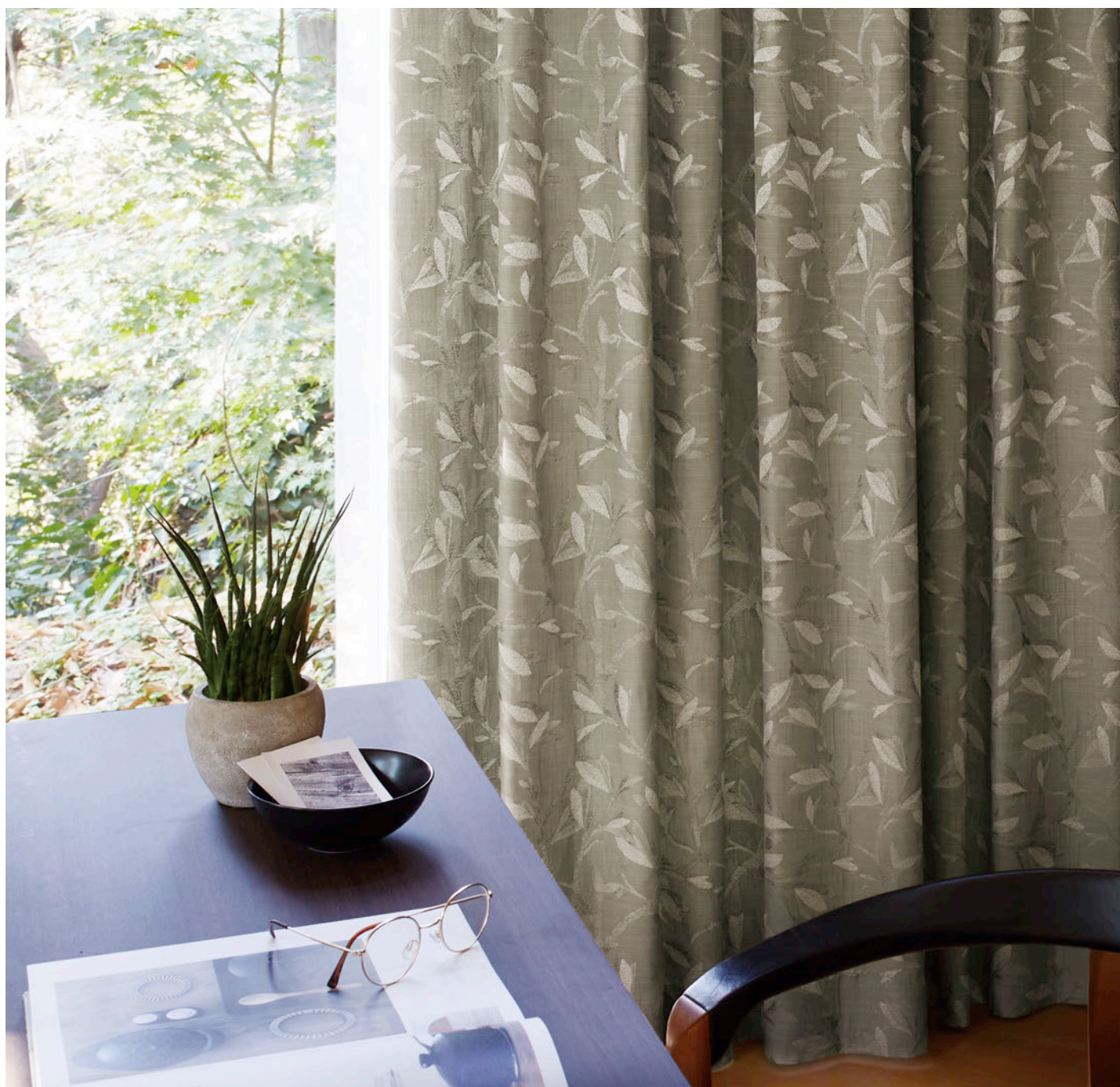
【ドレープ】TKF20004 ソフトプリーツ 【レース】TKF20691 ソフトプリーツ