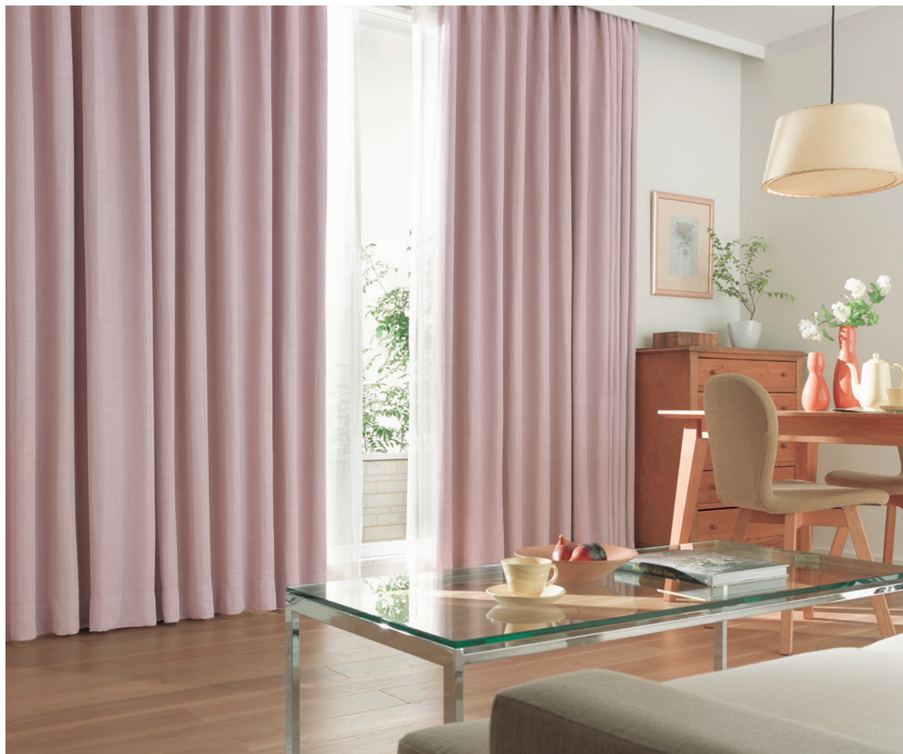
【ドレープ】TKF10540 ソフトプリーツ 【レース】TKF10668 ソフトプリーツ