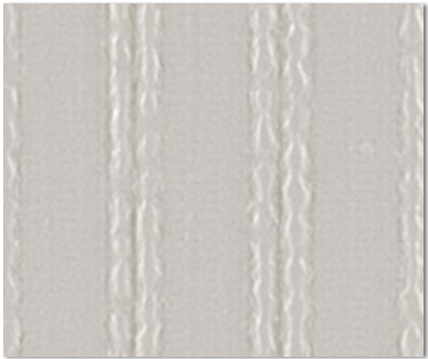
WVP 8297 NEW