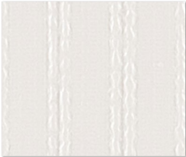
WVP 8296 NEW