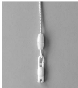
セーフティホック

操作コードに過度な荷重が掛かると、「セーフティホック」が外れるようになっていきます。